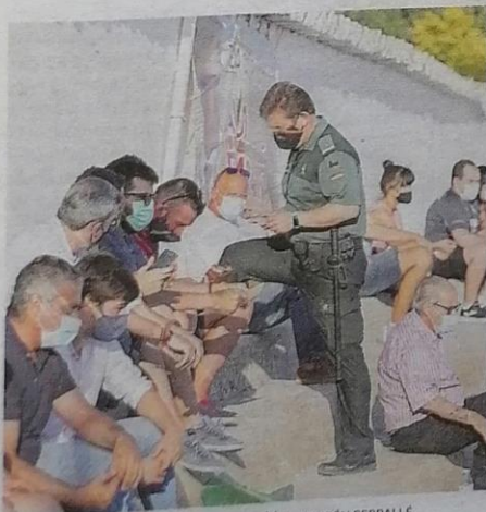
La guardia civil puso alguna sanción. / RUBÉN SERRALLE

Una gran novillada de La Quinta propició el triunfo del alumno de la escuela de Albacete, que cortó cuatro orejas y un rabo en el festejo