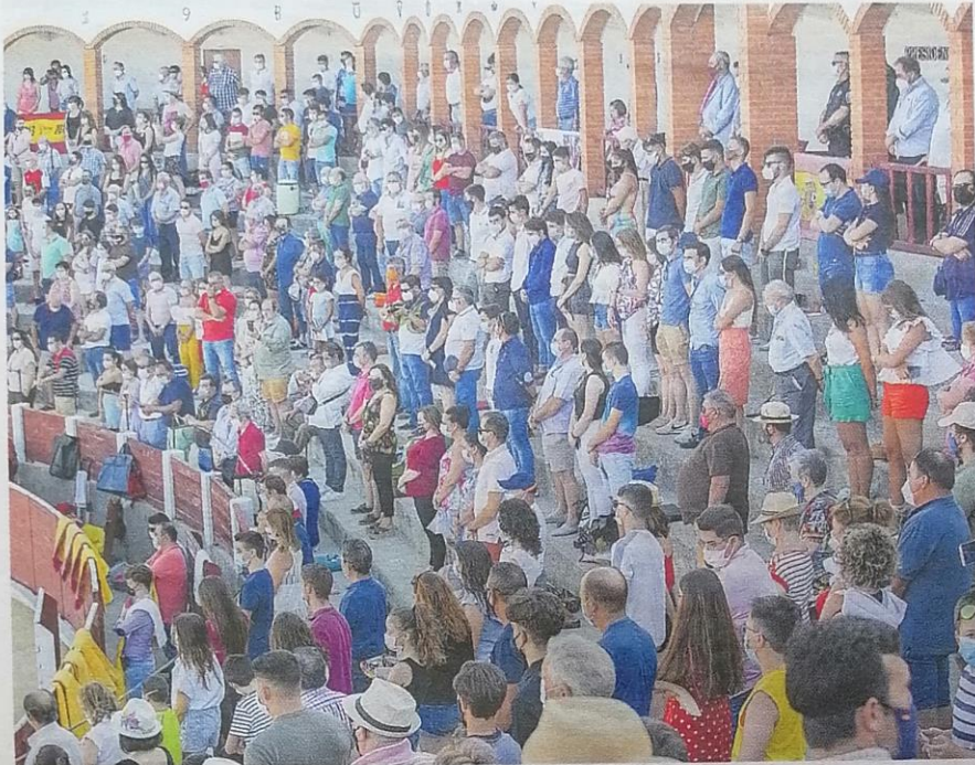
Aspecto del tendido en la plaza de toros de Munera.